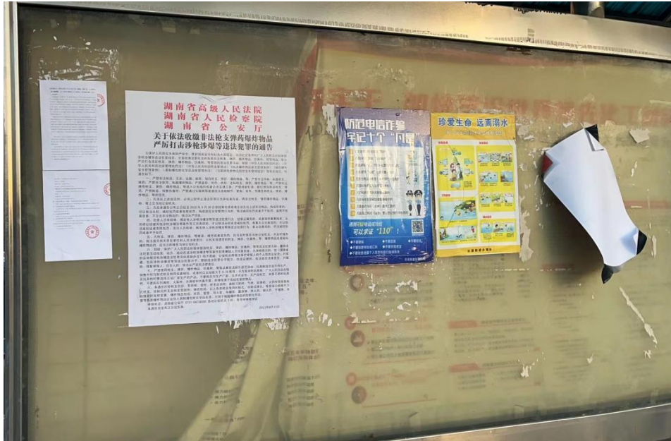
图 5 现场张贴公示照片

张贴区域选取的符合性分析：本项目张贴公示选取项目选择项目所在地社区委员会公开栏以及项目所在地，公众获取信息方便，并 2023 年 7 月 5 日起至 2023 年 7 月 18 日连续 10 个工作日，符合《环境影响评价公众参与办法》要求：通过在建设项目所在地公众易于知悉的场所张贴公告的方式公开，且持续公开期限不得少于 10 个工作日。