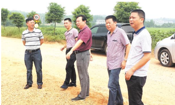
市交通质安局局长谢钢(中)深入主线公路建设现场督查指导工作