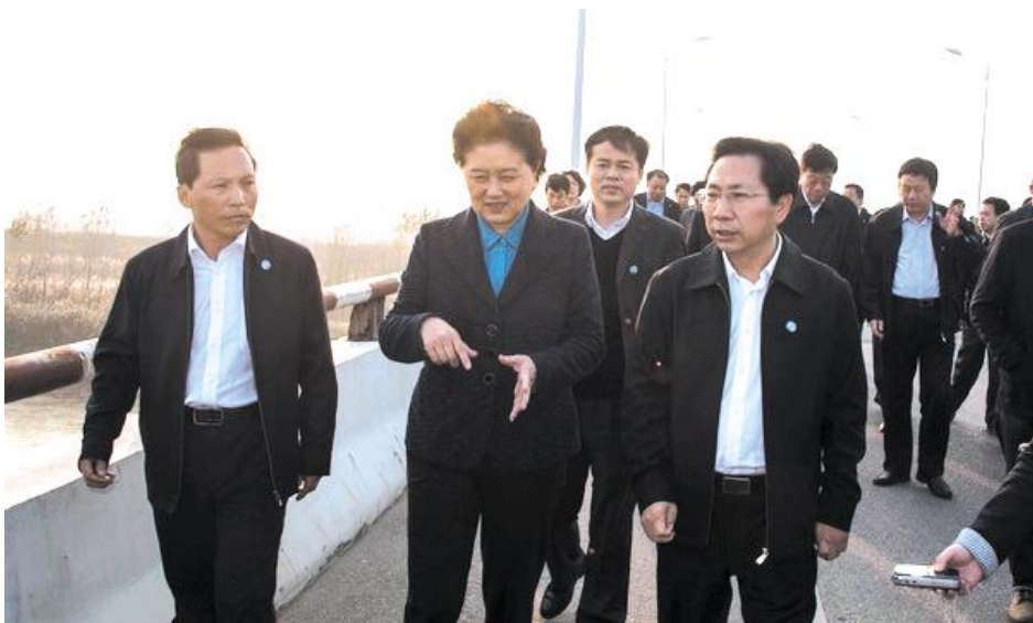
中央政治局委员、国务院副总理刘延东在湘阴视察调研血防工作(前排左三为湘阴县委书记黎作风、左一为湘阴县血防办主任王剑)

湘阴从降低血防疫情,保护人民群众身体健康目标出发,按照“预防为主、标本兼治、综合治理、群防群控、联防联控”的防治工作总方针,切实加强源头管理,强化综合整治,加快防治机制改革,血吸虫病防治工作取得了积极成效。目前,全县居民血吸虫病平均感染率、家畜血吸虫病平均感染率、登记在册的晚期血吸虫病人分别下降至 0.41%、0.38%和 337 人,与 2013 年相比,分别下降 43.06%、75.64%、21.63%,血防工作获得了国家、省、市主管部门的充分肯定和刘延东副总理的高度赞扬。