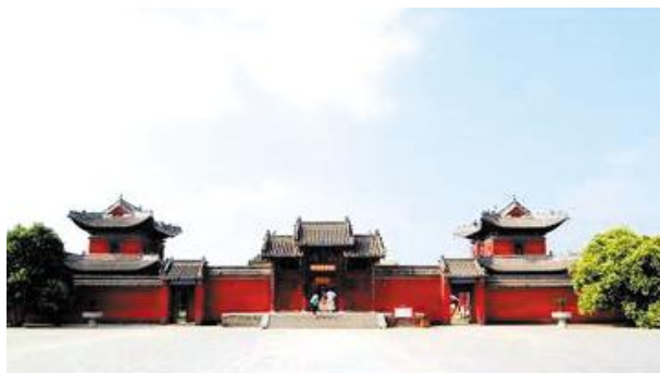
伏羲卦台广场大门(淮阳)

3、伏羲自汉末以来才演变成一个人,各类史书并有“生于成纪”、“都于陈”、“居于宛丘”、“葬于淮阳”的记载。因此,伏羲陵正如炎帝陵(于湖南炎陵县)、黄帝陵(于陕西黄陵县)、尧帝陵(于山西临汾县)、舜帝陵(于湖南宁远县)、大禹陵(于浙江绍兴县)一样,尊称祖庭,两千多年来为全国史学界、考古界和民众而认定,为国家级、省级定期举行盛大公祭大典的庄严场所。