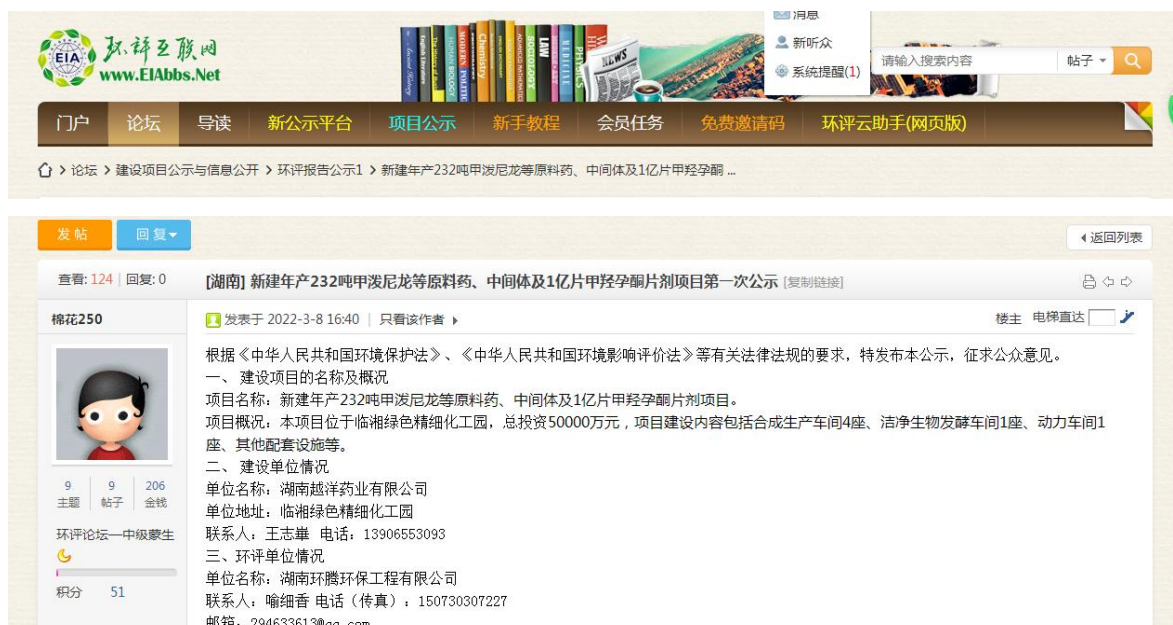
图 1 第一次环境影响评价网站公示截图照片