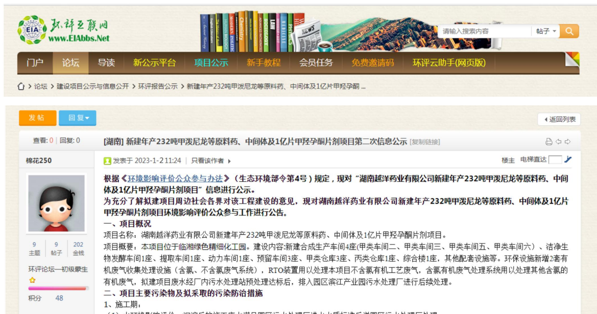
图2 第二次环境影响评价网站公示截图照片