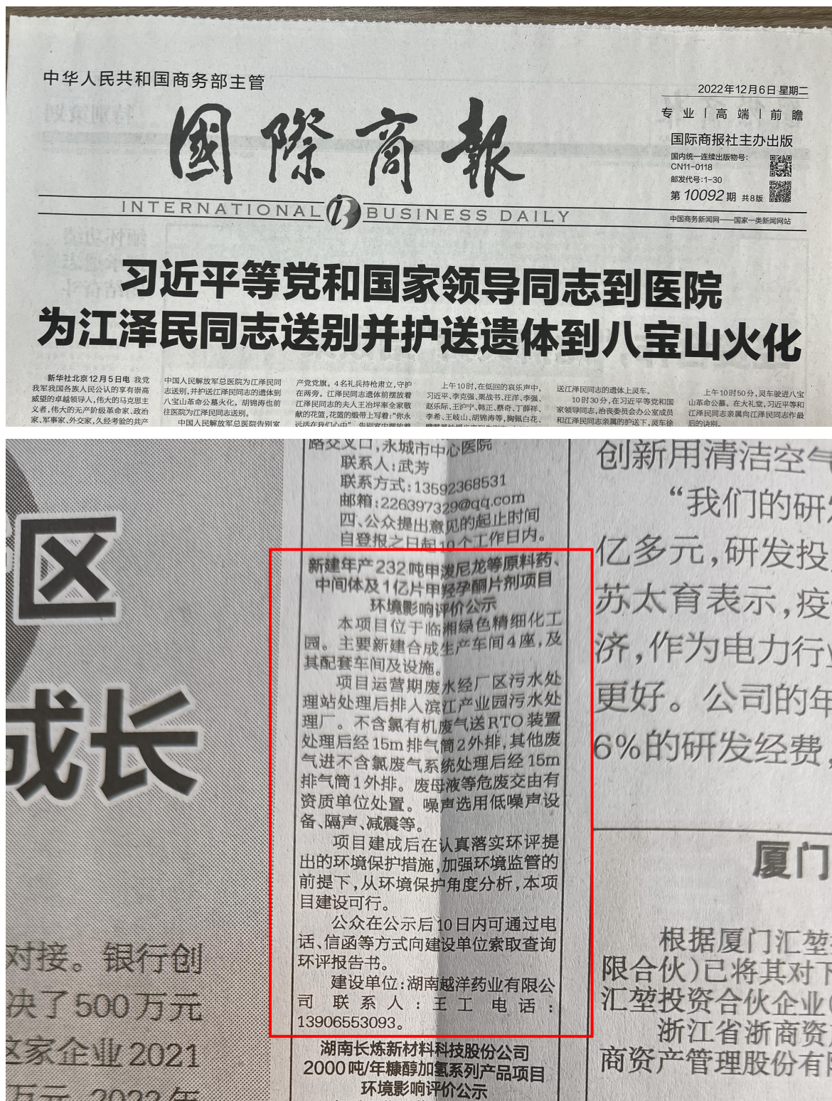
图 3-1 项目报纸上公示图片（第一次）