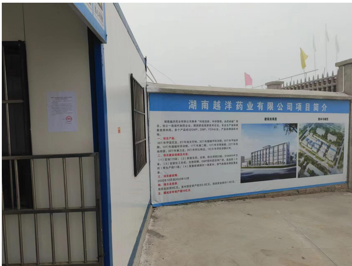
图 4 项目现场公示照片