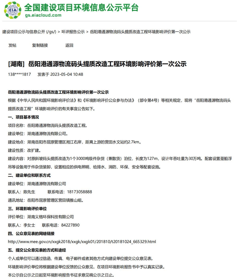
图 1 首次环境影响评价信息公开网站截图