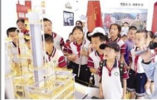
孩子们的参观展厅

安全小课堂，撑起“保护伞”。该中心关工委邀请辖区交警部门、消防保卫中心专业人士，以及蓝天救援队志愿者等，为孩子们和家长进行交通、居家和防溺水安全知识宣传，通过典型案例剖析安全事故危害和求救知识。