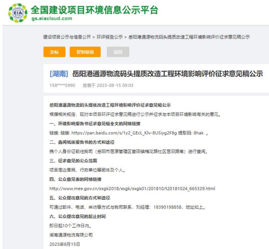
图 2 征求意见稿信息公开网站截图