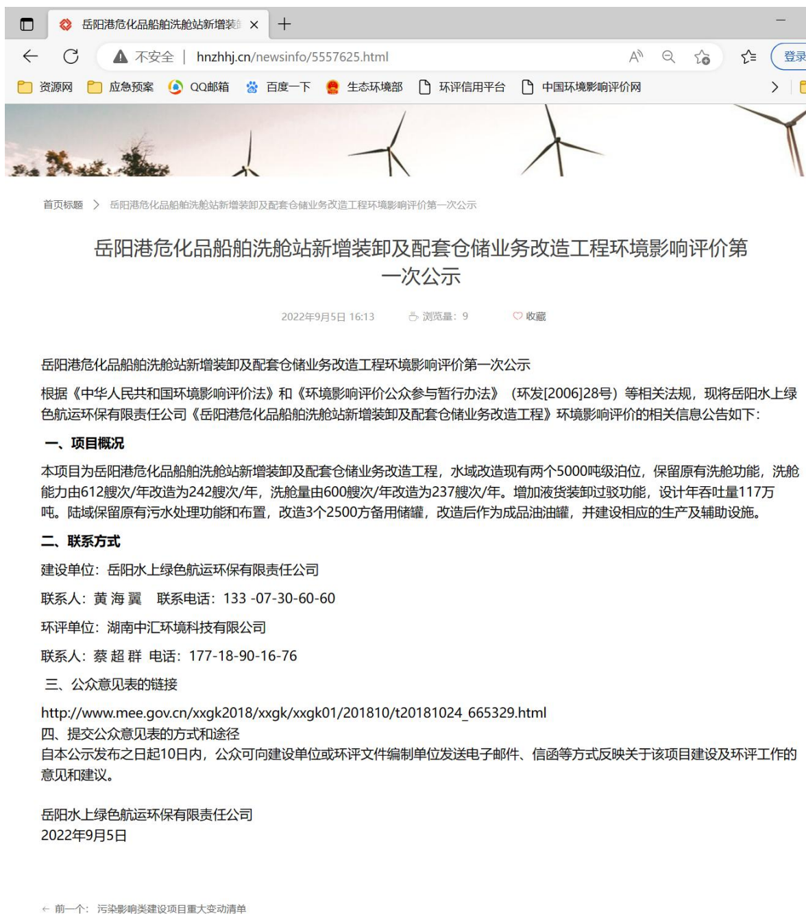
图 2.2-1 首次环境影响评价信息公开网络公示截图