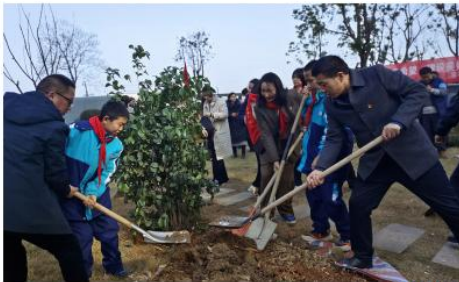
师生一起植树

本报讯(记者 黄诚成 通讯员 刘建家 谢漫迪)初春时节,岳阳楼区环球融创实验学校校园里阳光明媚、和风拂面、书声琅琅,一派生机