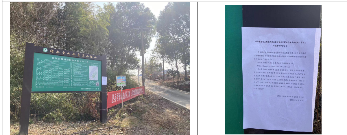
陆城镇枫桥湖现场张贴照片