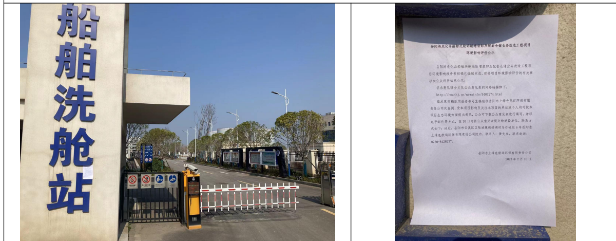
建设单位厂区门口张贴照片