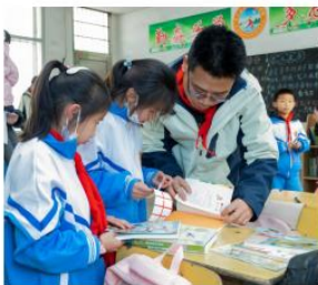
学生们收到期盼已久的书籍