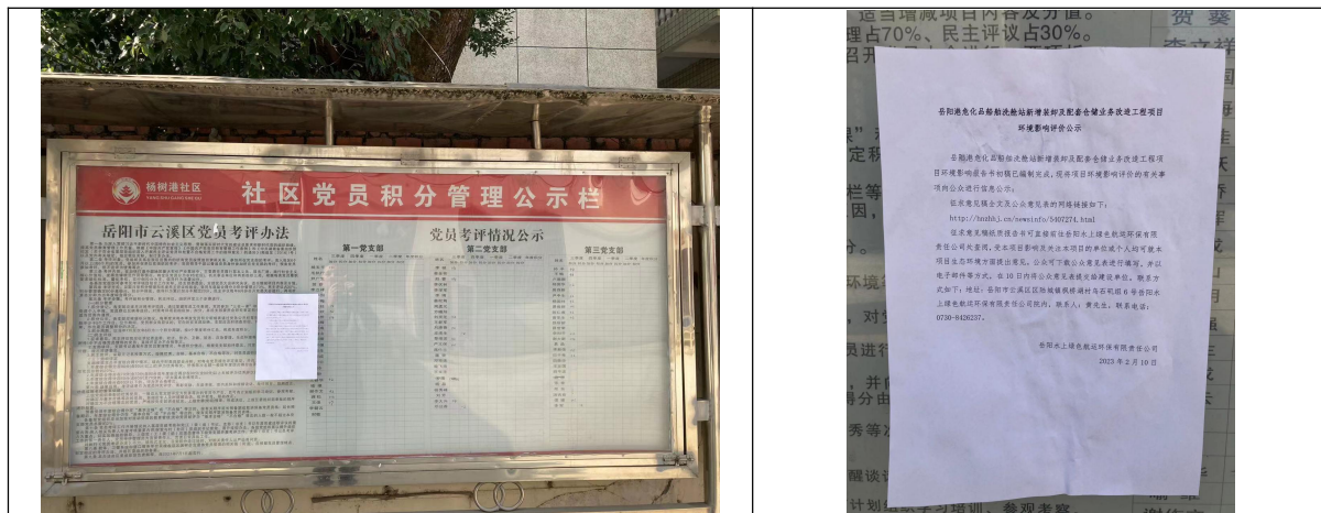
杨树港社区现场张贴照片

结合征求意见稿公示网上公示及登报纸公示，为方便项目区公众了解项目信息，项目于2023年2月10日开始，在征求意见稿公示期间（2023年2月10日~2023年2月23日），同步在项目现场、云溪枫桥湖社区和杨树港社区等地张贴了项目环评征求意见稿公示信息，相关照片如下。