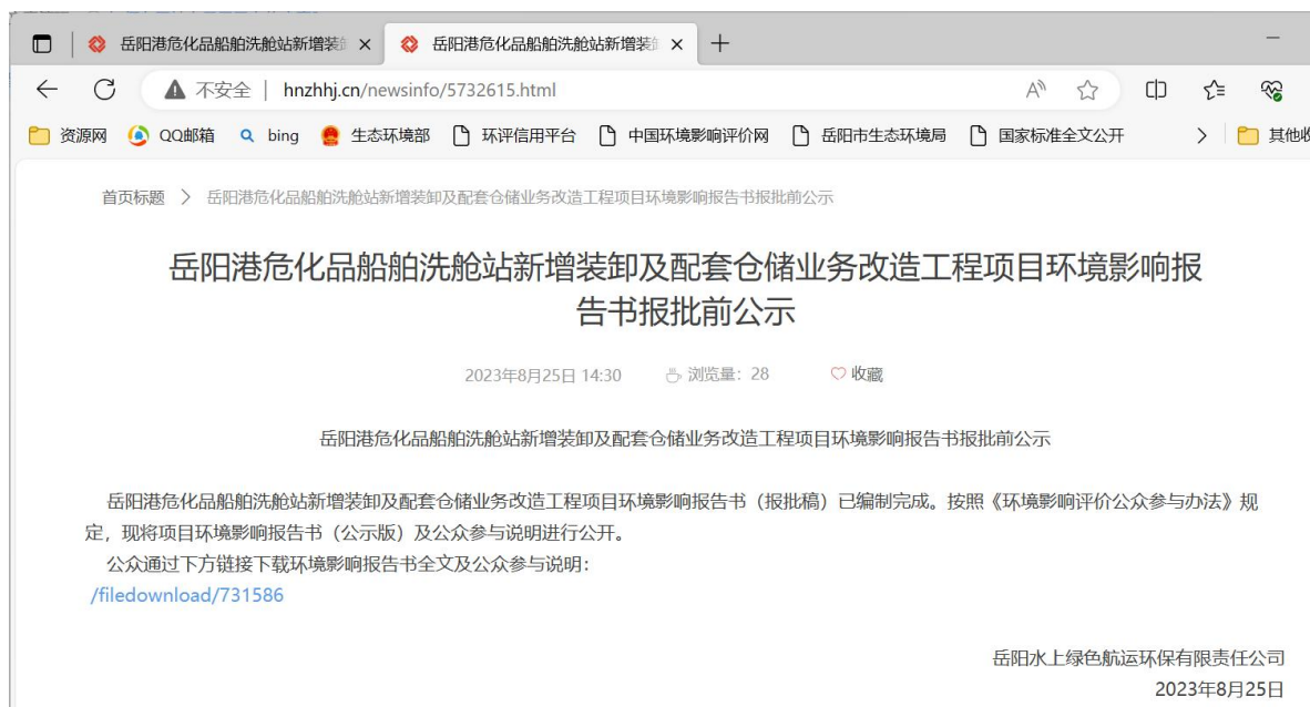
图 6.2-1 报批前网络公示截图

项目报批前公开方式为网络公示,公开时间为 2023 年 8 月 25 日,网址链接为 http://hnzhhj.cn/newsinfo/5732615.html ,报批前公示截图见下图。