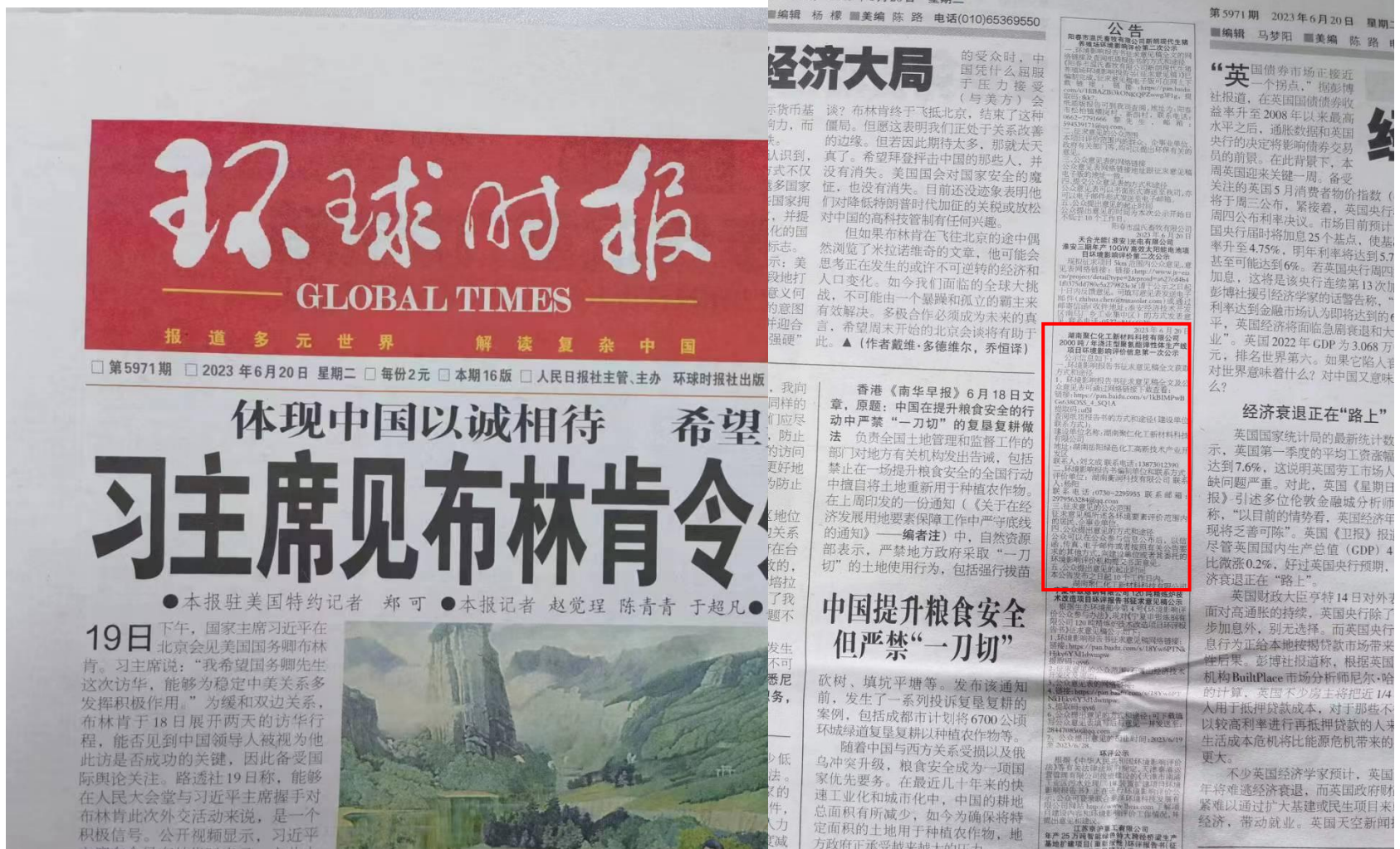
图3 第一次报纸公示