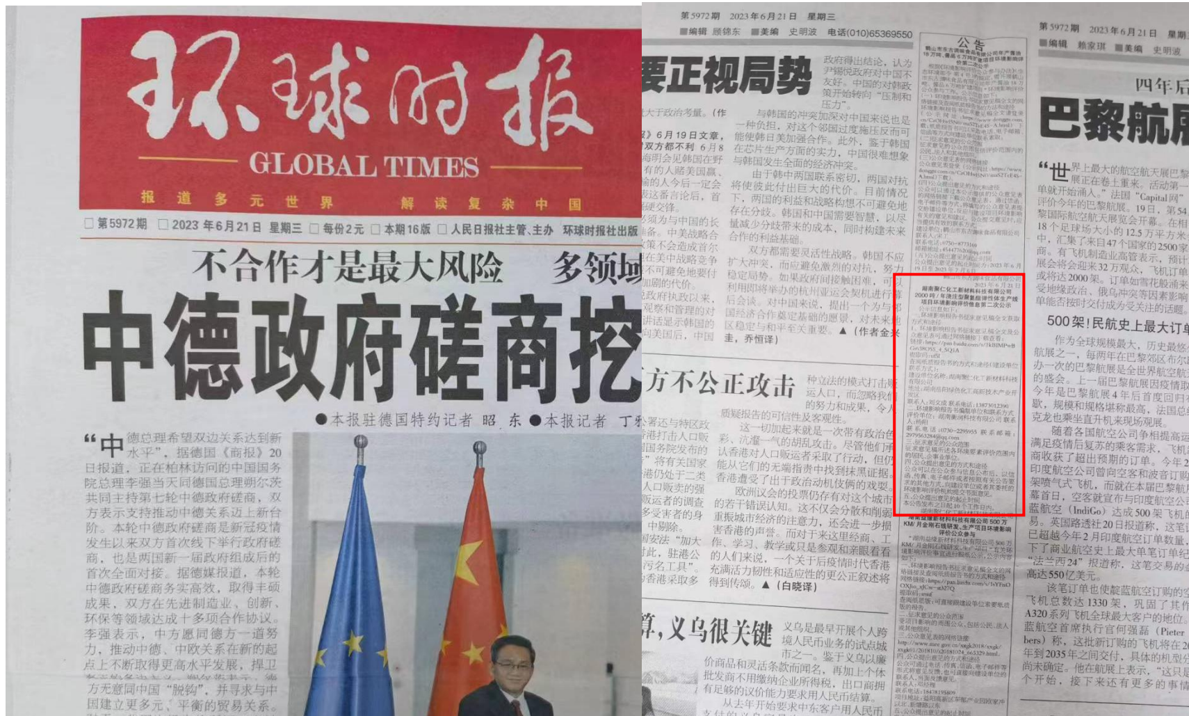
图4 第二次报纸公示