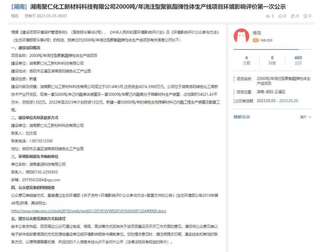
图1 首次网络公示截图

公示网站为环评互联网，网址为： https://www.eiacloud.com/gs/detail/3?id=305052Y0Ea ，在环境影响报告书征求意见稿编制过程中，公众均可向建设单位提出与环境影响评价相关的意见。公示截图见图1。